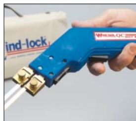
引き金式の電源入切スイッチ