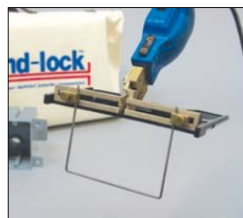
最大15cm幅まで切断可能