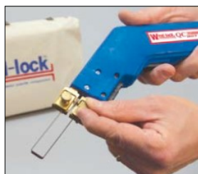
刃・付属品の取付・取外しが簡単