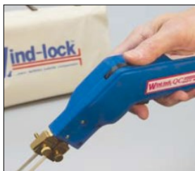
微調整できる温度調整